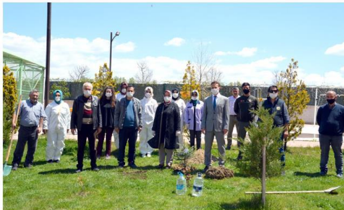
Her iki anne için yurt bahçesine fidan dikildi.