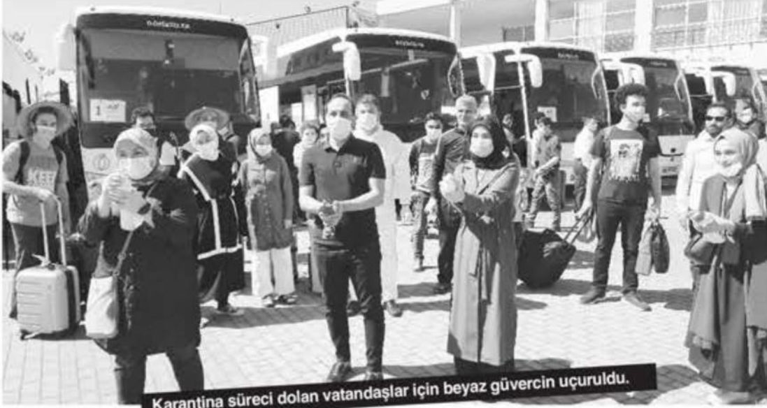
Karantina süreci dolan vatandaşlar için beyaz güvercin uçuruldu.

Dünya genelinde yaşanan koronavirüs salgını nedeni ile Malezya, Nijerya ve Gana'dan getirilerek Aydın'da karantinaya alınan 210 Türk vatandaşı, beyaz güvercin ve fidanlarla evlerine uğurlandı.